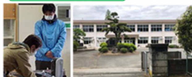
滑河小学校の跡地を利用した滑河文化財保存 展示施設で東京サラヤさんの手洗いチェック