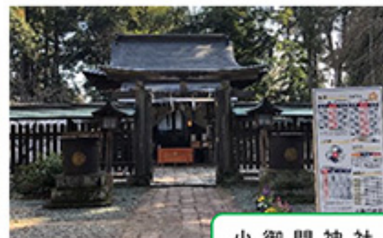
小御門神社 がんばりコース