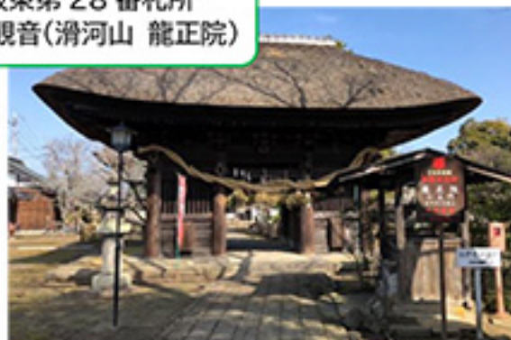
坂東第 28 番札所 滑河観音(滑河山 龍正院)