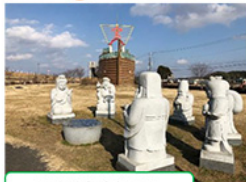
下総利根宝船公園