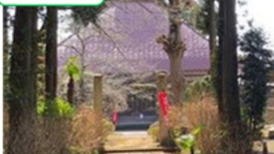
乗願寺 がんばりコース